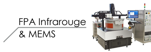
FPA Infrarouge & MEMS