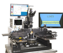
Milimétrique & Therahertz